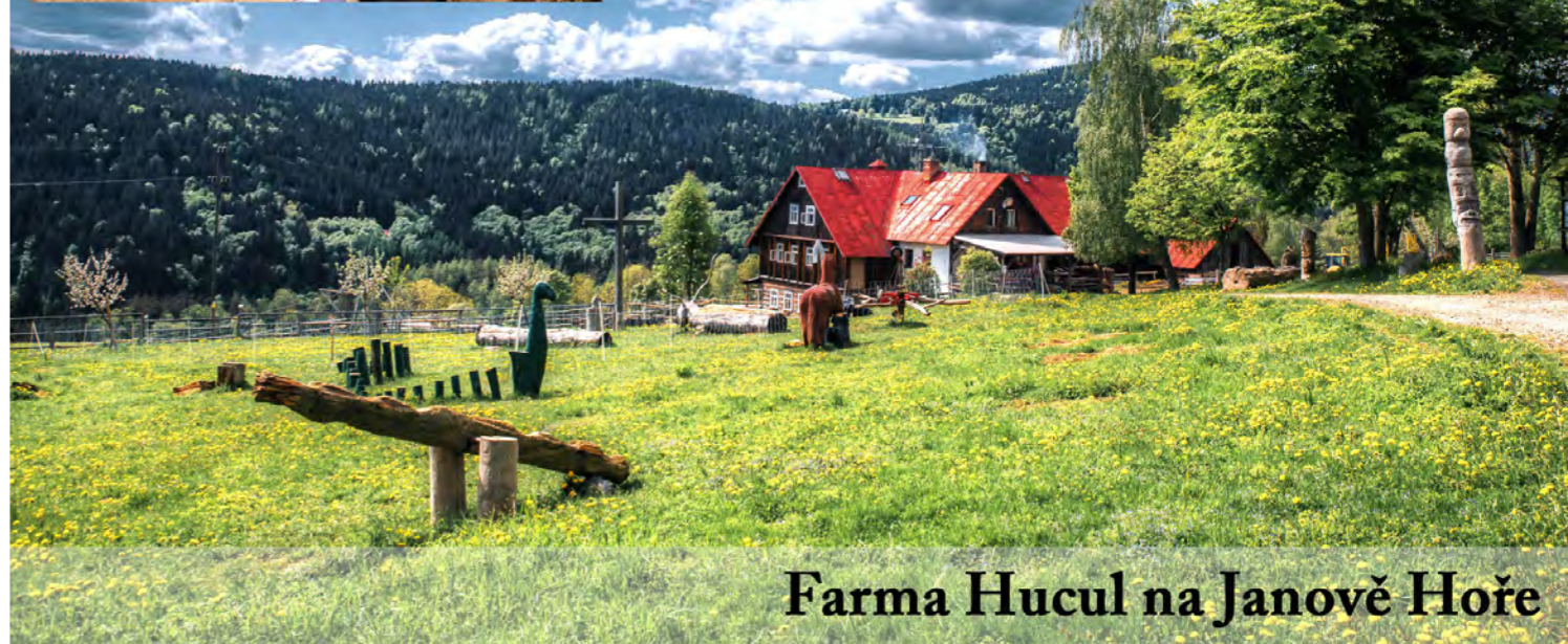
Farma Hucul na Janově Hoře