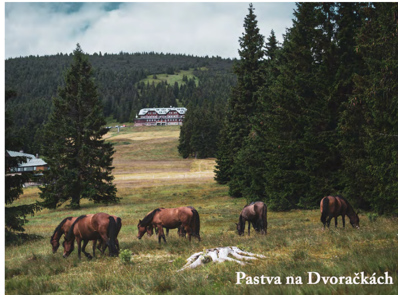
Pastva na Dvoračkách