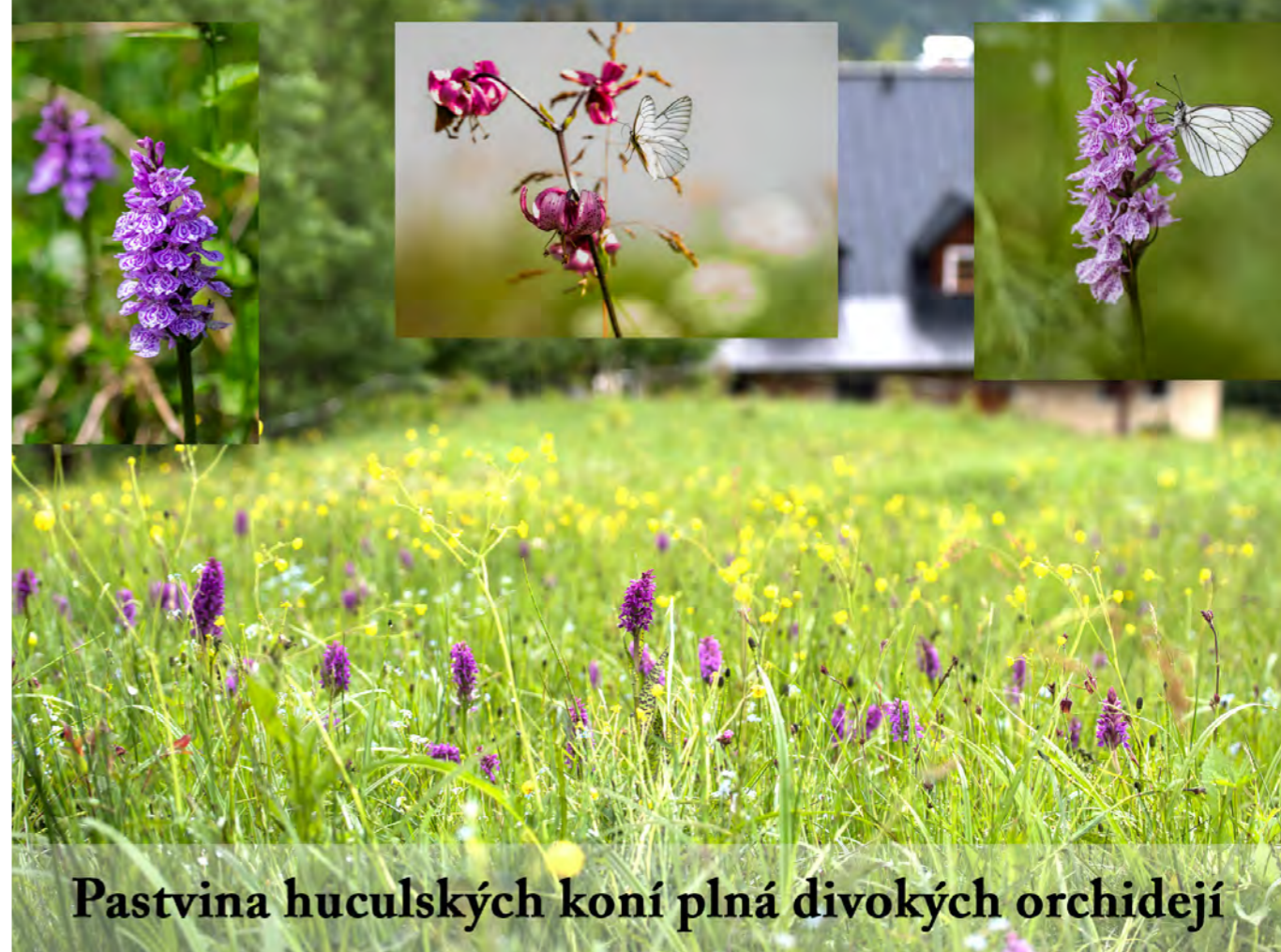
Pastvina huculských koní plná divokých orchidejí

Ivan K.: Plemenitbu tehdy vedl Státní plemenářský podnik. Po revoluci v r. 1989, když se ustanovila Asociace svazů chovatelů koní, vedla plemenné knihy všech plemen koní v ČR včetně huculů tehdy ona. My jsme v té asociaci měli ambici si plemenářskou práci ohledně huculů dělat sami. Spolu s dalšími chovateli v ČR jsme